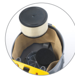
Filtro protezione motore + filtro a cartuccia