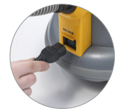
Presca per elettrospazzola