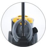
Attacchi tubo posteriore