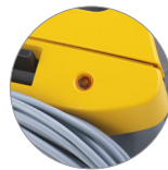
Spia riempimento sacchetto