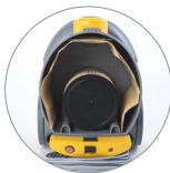
Vano interno di grandi dimensioni