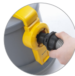
Innesto tubo a baionetta