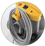
Cavo sganciabile da 15 metri